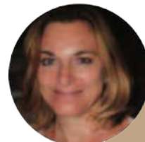
PR EVELYNE OLLIVIER PR DE PHARMACOGNOSIE UNIVERSITÉ DE MARSEILLE